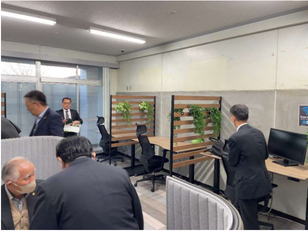
図9 大熊インキュベーションセンター 内観

現在、入居企業は100社（主に関東地方の企業、地元は20社）である。企業やベンチャー企業を誘致するためには、①通信環境、②サポートの仕組み、支援する人材、③町との一体が必要である。将来の基幹産業へ、町のサービスを解決していく中長期的な計画が重要である。入居者は24時間365日利用可能。利用料は町の条例で決まっている。（3000円/月）