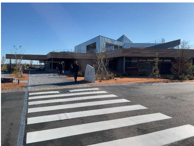
図12 学び舎ゆめの森 外観

地域の中心として0歳から15歳の子どもたちが、ともに遊び、学び、さらに地域の方々とも協働していく学び舎で2023年度誕生した。(図12)