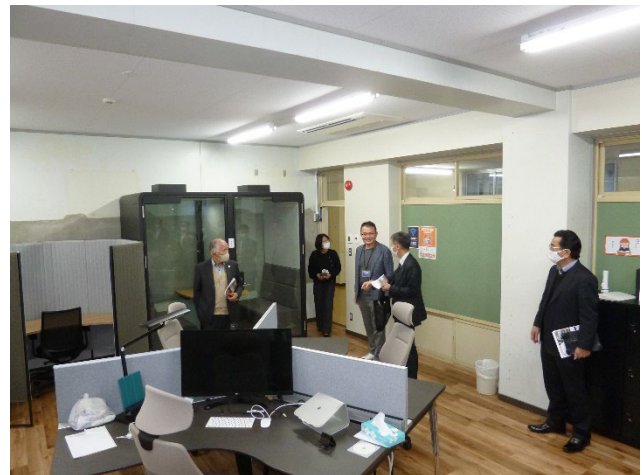
図8 大熊インキュベーションセンター 内観