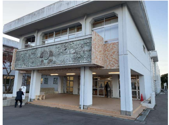
図7 大熊インキュベーションセンター 外観