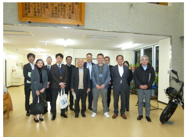
図 19 集合写真 (大熊インキュベーションセンター)