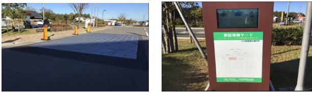
図2 車路ソーラープレートとモニタ

大熊町庁舎を訪問した際、最初に目にしたのは車路に敷かれたソーラープレートです。モニタには発電量、消費電力を表示されています。脱原子力の為には未利用エネルギー開発は急務だと感じました。(図2)