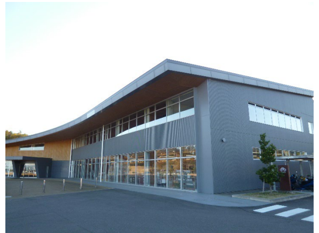
図1 大熊町役場 外観

復興拠点は2か所で、役場周辺の大川原地区とJR大野駅周辺の下野上地区である。(役場庁舎は鹿島建設が施工)(図1)