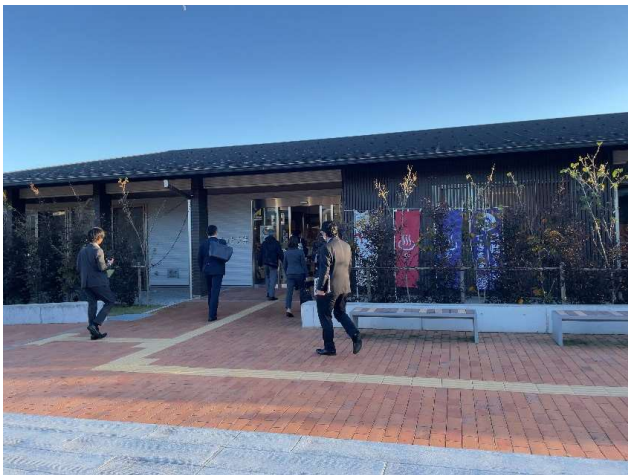
図6 宿泊温浴施設「ほっと大熊」 外観

貸事務室、コワーキングスペース、シェアオフィス、会議室、休憩室を配置する他、交流スペースを設け、入居企業だけではなく町民が集える場所として活用できることを意図している。建物改修は必要最小限とし、小学校の面影を残すことに拘った。(図8)