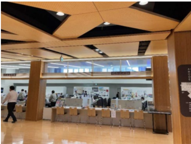
図3 役場庁舎 内観

コストのかけ方にメリハリがあると感じました。町役場関連の施設は、オシャレではあるが建材や施工技術は安普請な印象でした。(図3)