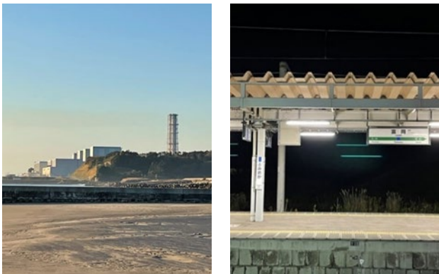
図 17 福島第二と JR 富岡駅

福島第二に近く JR 富岡駅前の宿泊先周囲は静寂。駅には東電作業員や中高生も。(図 17)