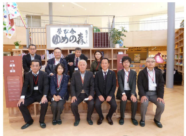
図 20 集合写真 (学舎ゆめの森)