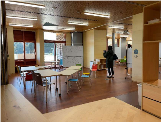
図 14 教室

ゆめの森の校舎には子どもたちが遊びながら学び、学びながら遊ぶ様々な仕掛けがある。自分の机に座ってじっくり考えるだけでなく、日常的に身体を思い切り使って五感で感じて考えられる環境をつくっている。