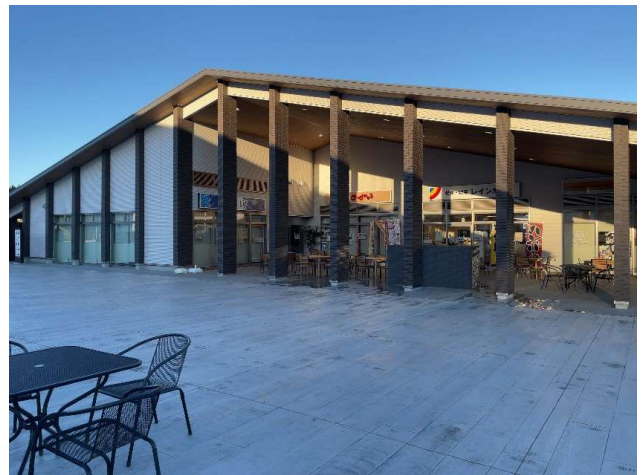
図4 商業施設「おおくまーと」 外観

三つの施設は、中庭を挟んで建てられている。商業施設にはコンビニエンスストア、雑貨店、飲食店などが入居している。町内にスーパーマーケットは、まだ無い。町の再重要課題とのことであった。