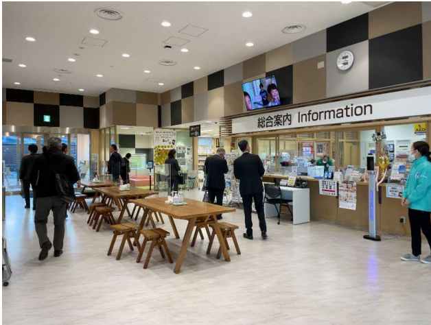
図5 交流施設「linkる大熊」 内観